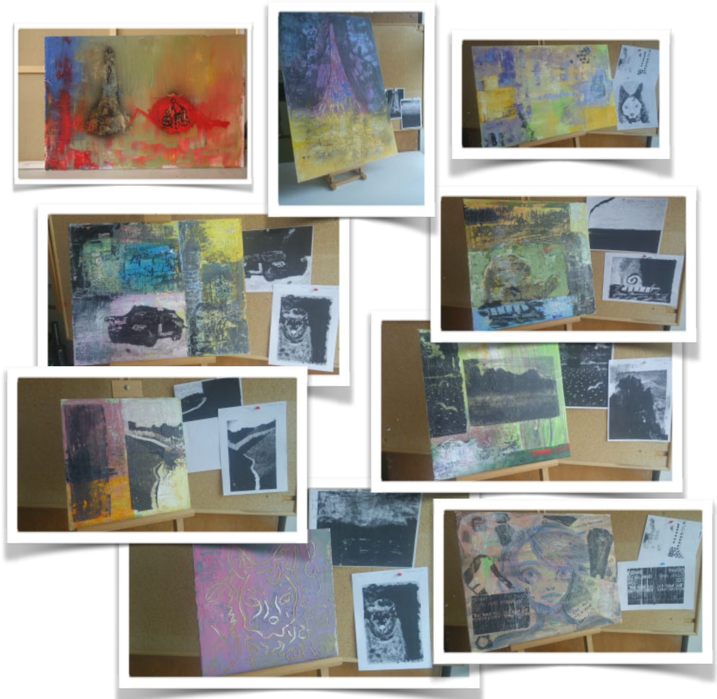
Fax de Varsovie et Budapest ré-appropriés au LFP sur toiles 2014